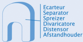
Ecarteur Separator Spreizer Divaricatore Distensor Afstandhouder